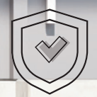
신뢰도 높은 보안성