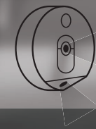
빈틈없는 듀얼 카메라