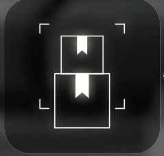
하단카메라 택배 감지