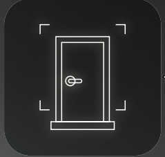
상단카메라 현관문 밖 상황 확인