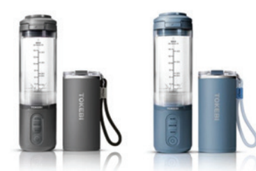
TBP-B0510G / TBP-B0510B