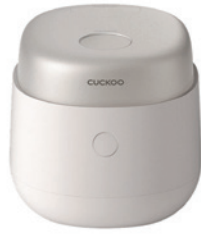
CRP-NHTRFF1010 10인용 CRP-NHTRFF0610 6인용