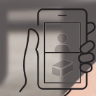
실시간 영상 모니터링