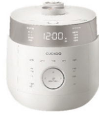
CRPLHTR1010FGW 10인용 CRPLHTR0610FGW 6인용