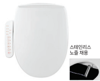
스테인리스 노즐 채용