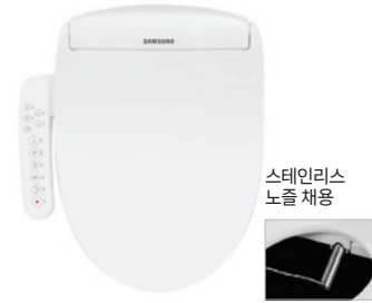
스테인리스 노즐 채용