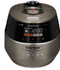
CRP-FHTS1010FB 10인용 CRP-FHTS0610FB 6인용