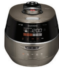
CRP-FHTS1010FB 10인용 CRP-FHTS0610FB 6인용