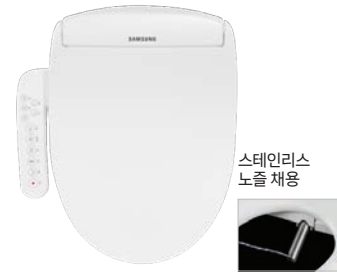
스테인리스 노즐 채용