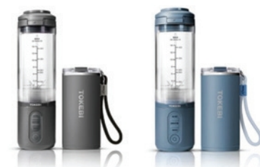
TBP-B0510G / TBP-B0510B