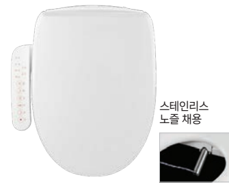
스테인리스 노즐 채용